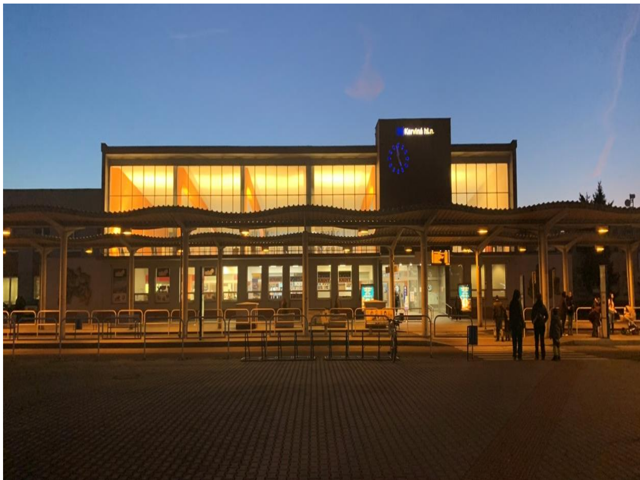
Obrázek 1 - Pohled od silnice