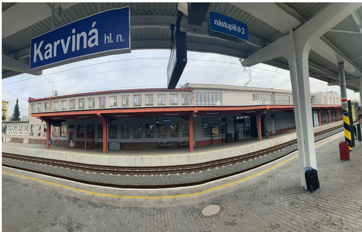
Obrázek 2 - Pohled na budovu od nádraží

Tento Design manuál je příkladovým podkladem pro určení standardů pro ocenění jednotlivých koncových prvků, materiálového a barevného provedení dodávek a montáží pro vytvoření porovnatelných cenových nabídek uchazečů o veřejnou zakázku stavby „Karviná ON – rekonstrukce části výpravní budovy“.